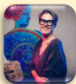
Dr.ssa Vera Gheno

Laureata in Sociologia, ha svolto esperienze di volontariato in Italia in diverse strutture sociali e sociosanitarie, presso associazioni che si occupano di sport e disabilità, nei servizi di urgenza ed emergenza, e in Africa in centri per bambini. Ha lavorato per molti anni nel campo dell'assistenza, della cura, dell'educazione e dell'accoglienza di persone adulte con disabilità intellettiva. Ha diretto una Comunità Alloggio a Como, è stata assessore alle Politiche Sociali e Vicesindaco, parlamentare e assessore alle Politiche sociali e della Famiglia di Regione Lombardia. Dal 22 ottobre 2022 è Ministro per le Disabilità nel governo Meloni.