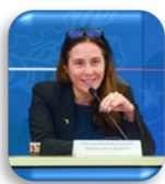
Alessandra Locatelli Ministro per le disabilità

Laureata in Sociologia, ha svolto esperienze di volontariato in Italia in diverse strutture sociali e sociosanitarie, presso associazioni che si occupano di sport e disabilità, nei servizi di urgenza ed emergenza, e in Africa in centri per bambini. Ha lavorato per molti anni nel campo dell'assistenza, della cura, dell'educazione e dell'accoglienza di persone adulte con disabilità intellettiva. Ha diretto una Comunità Alloggio a Como, è stata assessore alle Politiche Sociali e Vicesindaco, parlamentare e assessore alle Politiche sociali e della Famiglia di Regione Lombardia. Dal 22 ottobre 2022 è Ministro per le Disabilità nel governo Meloni.